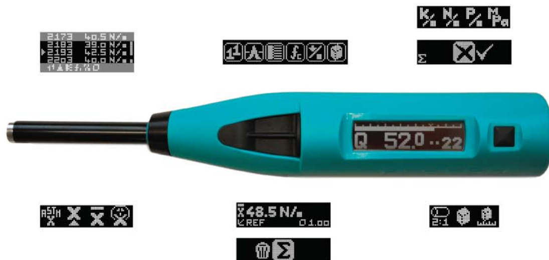
SilverSchmidt junto con una selección de varias pantallas

La estructura del menú es sencilla, similar a la interfaz de un teléfono móvil. Prácticamente cada comando puede activarse o bien directamente o a través de máximamente 2 pasos consecutivos. Esto permite la selección del modo de medición (modo de impacto único, varios modos de promediación) y de la curva de conversión deseada (resistencia a la compresión con factor de forma y unidad / valor de rebote Q). Todos los datos se guardan automáticamente y pueden ser revisados en la lista de datos.